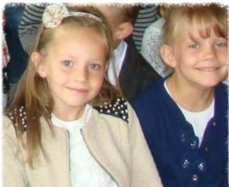
Rozpoczęcie roku 2013/2014