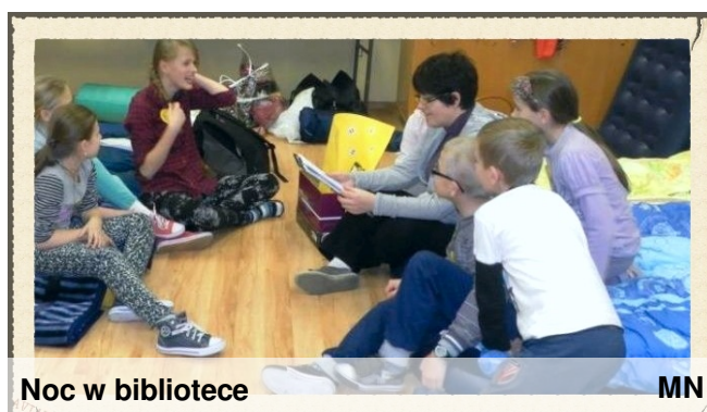
Noc w bibliotece

Najwięcej emocji dostarczyła Godzina Duchów – opiekunowie wyposażeni w latarkę oprowadzali przy zgaszonym świetle swoją grupę po szkole. Zadaniem grup było odnaleźć plakaty z portretami baśniowych i bajkowych postaci i zapamiętać wskazane litery, które utworzą hasło. Po drodze, idąc za strzałkami, zbierali też koperty z zadaniami, które rozwiązywali po powrocie na salę gimnastyczną. Sprawdzili w ten sposób swoją pamięć, spostrzegawczość oraz logiczne myślenie. Około godziny 2.30 rozpoczęliśmy oglądanie bajki „Kopciuszek. Co by było gdyby...”. Wyniki rywalizacji zostały ogłoszone tuż po pobudce,