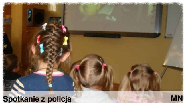
Spotkanie z policją

W ramach akcji "Bezpieczna droga do szkoły", w dniu 10 września 2013 r. odbyło się spotkanie uczniów klas 0 – VI z przedstawicielem policji z Komendy Powiatowej w Białobrzegach - mł. asp. Jarosławem Rdzankiem. Celem spotkania było przypomnienie podstawowych zasad ruchu drogowego. Policjant zwrócił dzieciom uwagę na zachowanie bezpieczeństwa i ostrożności podczas drogi do i ze szkoły oraz przedstawił zalety wynikające z korzystania z elementów odblaskowych. Przekazał dzieciom jakie niebezpieczeństwa mogą na nich czyhać na drodze i w domu. Niezwykle cenne były informacje na temat właściwych zachowań w sytuacjach zagrażających życiu i zdrowiu. Na zakończenie spotkania dzieci obejrzały film pt. „Bezpiecznie do szkoły”. Spotkanie było bardzo ciekawe i pouczające. Wiedza, którą uzyskali uczniowie na pewno przyda się im w ich dalszym życiu.