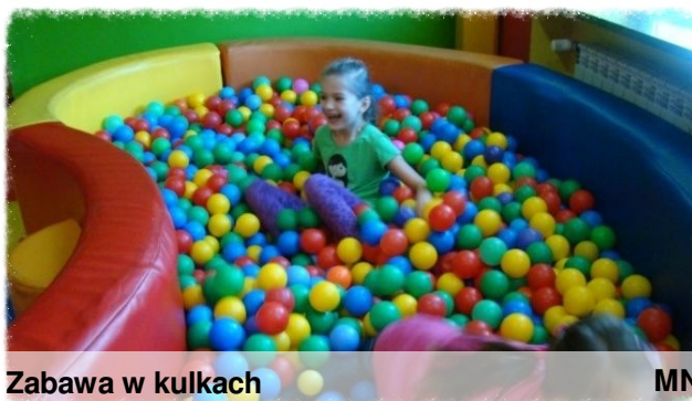
Zabawa w kulkach

Zgodnie ze zwyczajem, 30 września obchodzimy Dzień Chłopaka. Rokrocznie w naszej szkole odbywały się z tej okazji dyskoteki, jednak w tym roku postanowiliśmy świętować trochę inaczej. Ten przepiękny słoneczny dzień rozpoczęliśmy od wyjazdu do kina Helios w Radomiu, gdzie obejrzelśmy film animowany pt. „Turbo”. Główny bohater, ślimak o imieniu Teoś, ma tylko jedno marzenie – bycie szybkim (co w przypadku ślimaków nie jest łatwe). Jednakże, podążając za swoim marzeniem, niepozorny Teoś nabywa niezwykłych mocy pozwalających mu rozwijać zawrotną prędkość. Postanawia nawet wziąć udział w bardzo popularnym wyścigu bolidów i mimo wielu przeciwności wygrywa go. Wartka akcja, zabawne dialogi oraz główne przesłanie filmu, czyli wiara we własne możliwości bardzo podobała się uczniom naszej szkoły. Z iście „turbo doładowaniem” rozpoczęliśmy dwugodzinne szaleństwo w sali zabaw „Kraina Marzeń”. Baseny z kulkami, trampoliny, dmuchane zamki, dziesiątki tuneli i zjeżdżalni znalazły wielu amatorów z naszej szkoły.