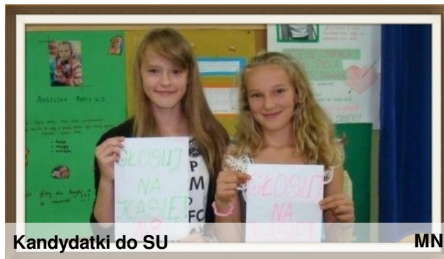
Kandydatki do SU

Teraz przyszła pora na spełnianie obietnic przedwyborczych - czekamy z niecierpliwością na kolorowe dni, dzień pluszowego misia, szczęśliwy numerek, liczne konkursy i dyskoteki, które pojawiły się w programach wyborczych kandydatów. Życzymy powodzenia!