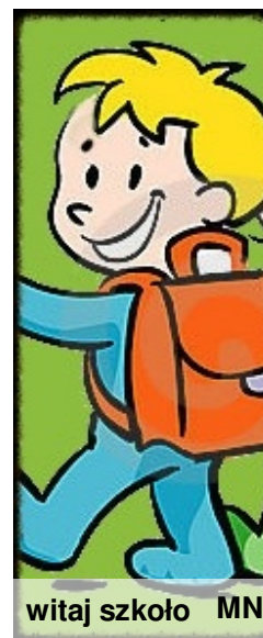
witaj szkoło MN

Witaj nam, szkoło radosna, grająca dzwonkiem co rano! Dzień dobry, szkoło wesole. Lesie i łąko - dobranoc.