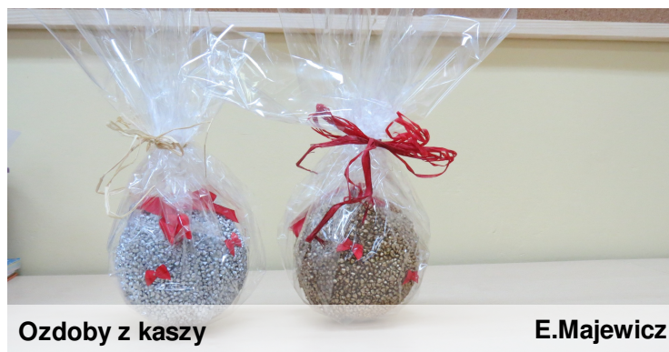
Ozdoby z kaszy