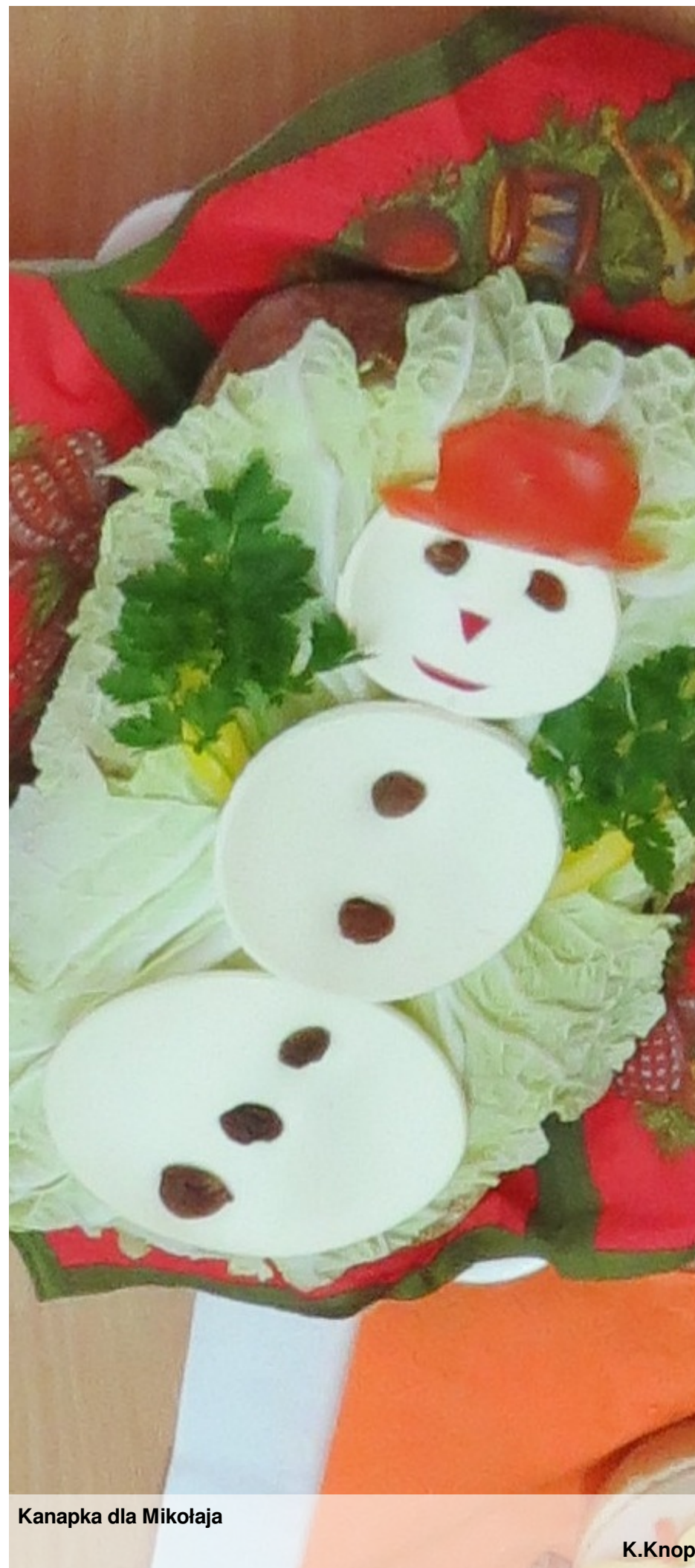
Kanapka dla Mikołaja

Kanapka to smaczny i zdrowy pomysł posiłek, jeśli zadbamy o odpowiednie jej urozmaicenie.