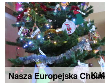
Nasza Europejska Choinka