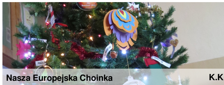
Nasza Europejska Choinka

Wszystkie ozdoby znalazły się na naszej choince. Ozdoby były rozmaite np. gwiazdeczki, trzej królowie, pierniki. Należy zwrócić uwagę na materiały z których były wykonane: kasza gryczana, piernik, papier, materiały ekologiczne.