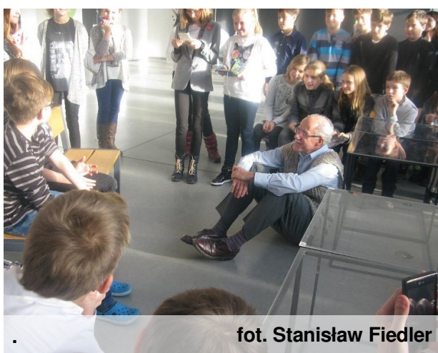
fot. Stanisław Fiedler