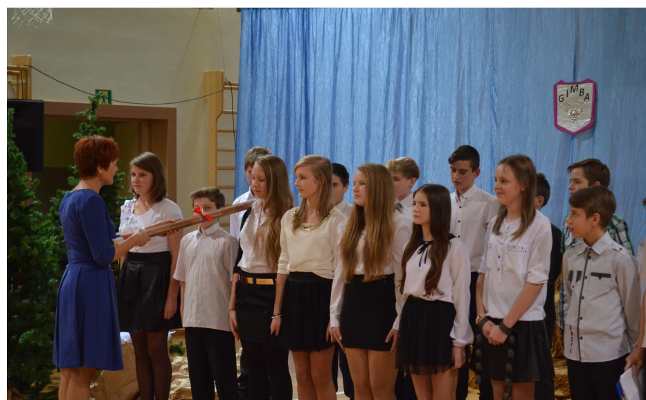
Pasowanie na gimnazjalistów przez dyrektor szkoły