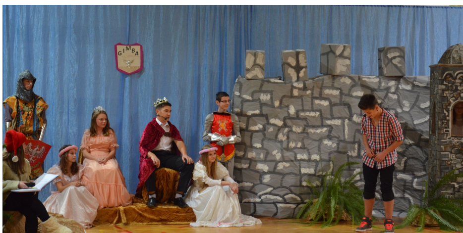
Witajcie w królestwie Gimba