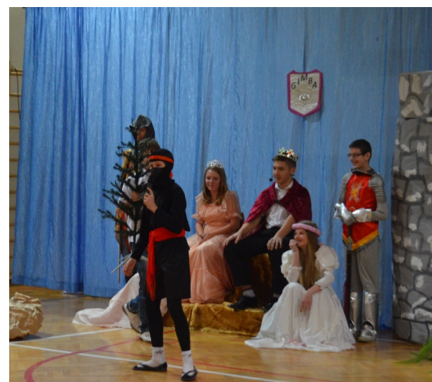
Czy ninja uratuje królestwo?