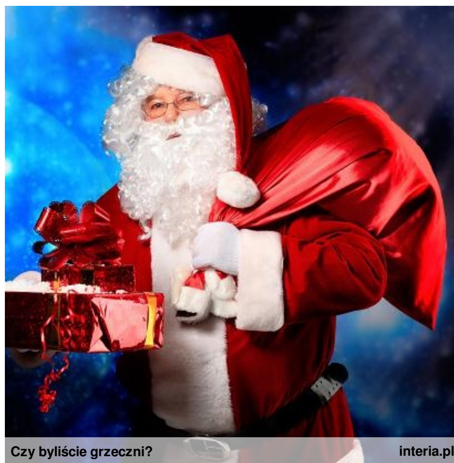
Czy byliście grzeczni?