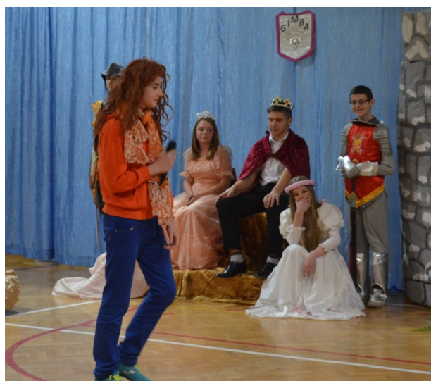
...a może Dżoanna zabije smoka?