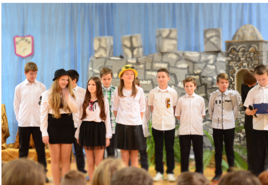
Pierwszoklasiści prezentują swoje zdolności