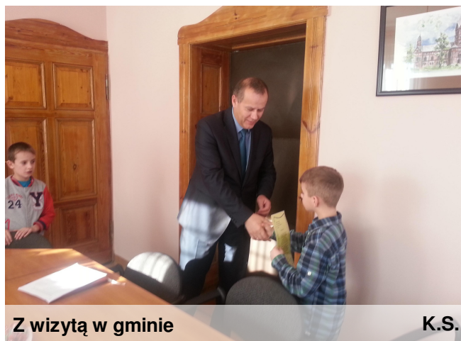
Z wizytą w gminie