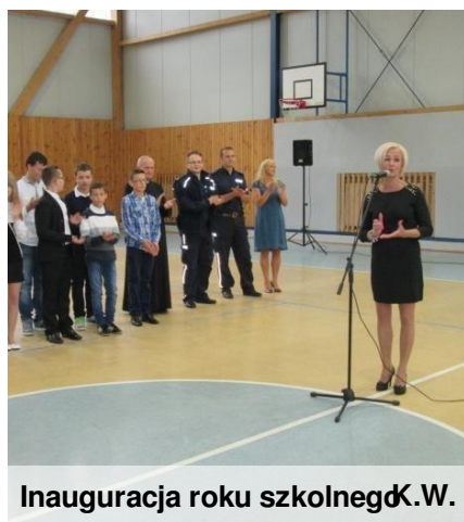
Inauguracja roku szkolnego K.W.

Niestety, wszystko co przyjemne szybko się kończy.