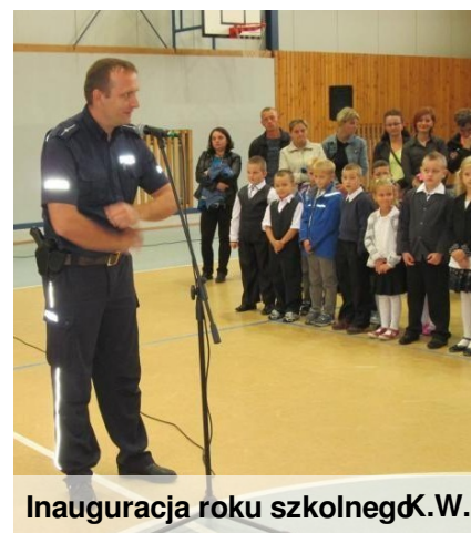
Inauguracja roku szkolnego K.W.