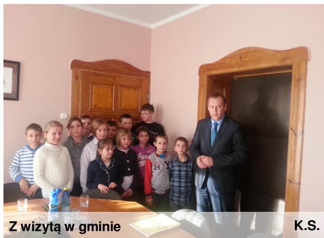
Z wizytą w gminie