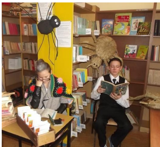
Konkurs 'Książki naszych marzeń'