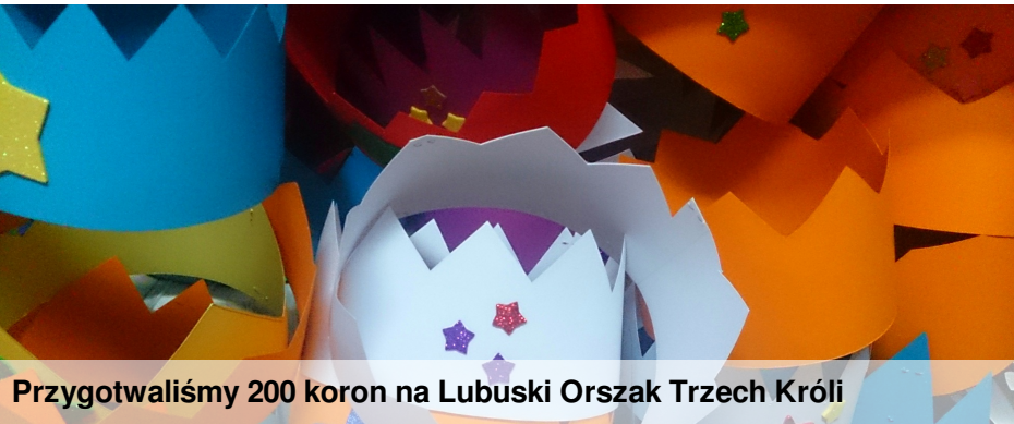
Przygotowaliśmy 200 koron na Lubuski Orszak Trzech Króli

18-19 grudnia odbywały się adwentowe rekolekcje szkolne, które prowadziły siostry ze Zgromadzenia Jezusa Miłosiernego z Bledzewa. Był to czas solidnego przygotowania do świąt Bożego Narodzenia.