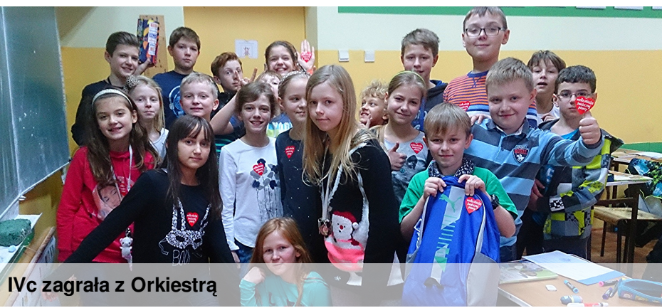
IVc zagrała z Orkiestrą