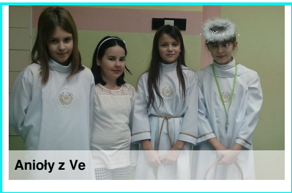
Anioły z Ve

16 grudnia obchodziliśmy "Dzień Anioła". W tym dniu braliśmy udział w konkursach i przypominaliśmy sobie wzajemnie o potrzebie bycia dobrym dla drugiego człowieka!