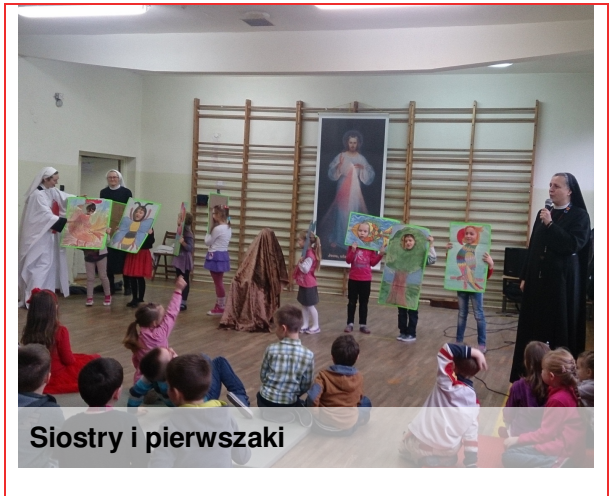
Siostry i pierwszaki

16 grudnia obchodziliśmy "Dzień Anioła". W tym dniu braliśmy udział w konkursach i przypominaliśmy sobie wzajemnie o potrzebie bycia dobrym dla drugiego człowieka!