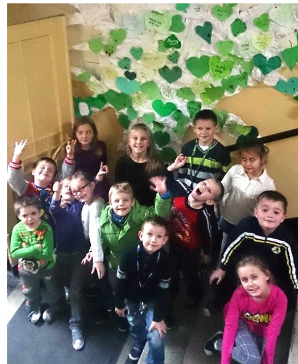
Świetliczaki i ich "Drzewo życzeń"

Z okazji przypadającego na 19 listopada Międzynarodowego Dnia Zapobiegania Przemocy Wobec Dzieci w naszej świetlicy szkolnej została zorganizowana dwutygodniowa akcja mająca na celu refleksję nad zjawiskiem krzywdzenia niepełnoletnich.