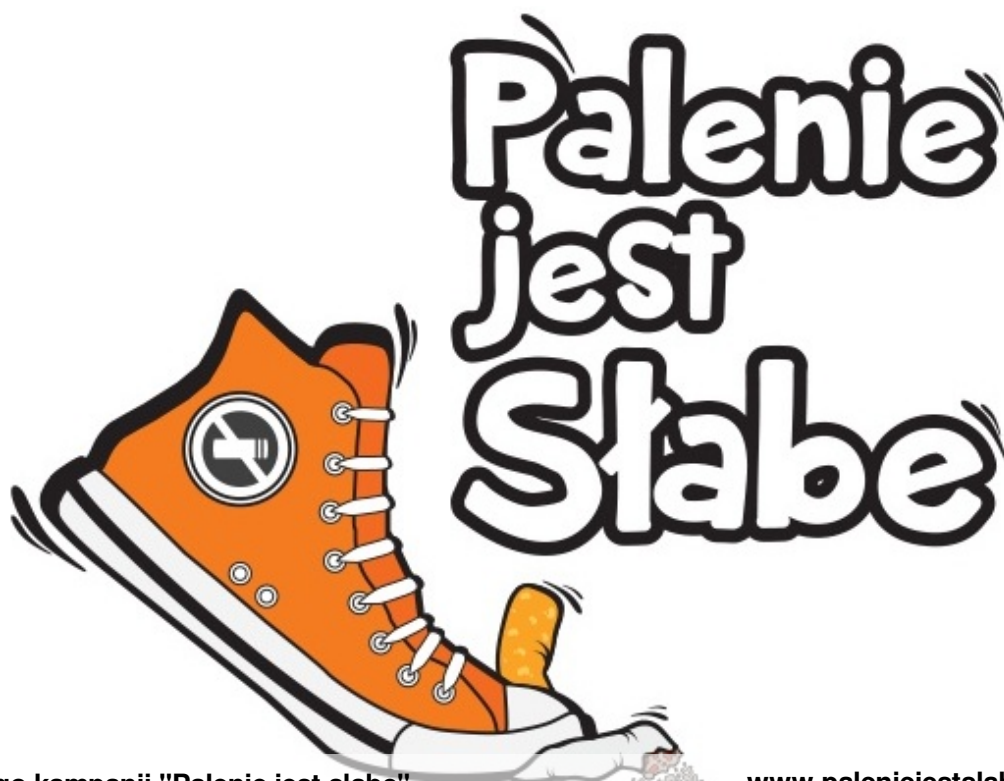
Logo kampanii "Palenie jest słabe"