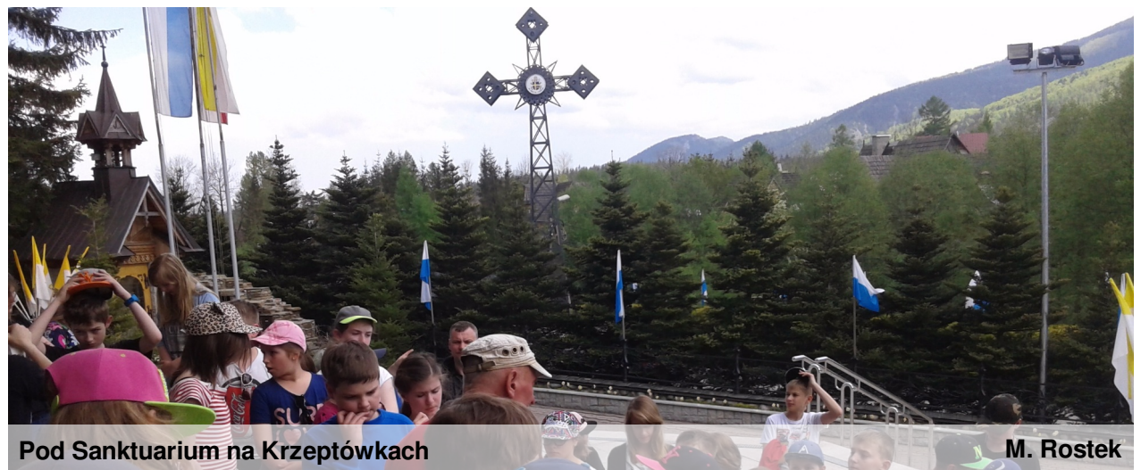
Pod Sanktuarium na Krzeptówkach