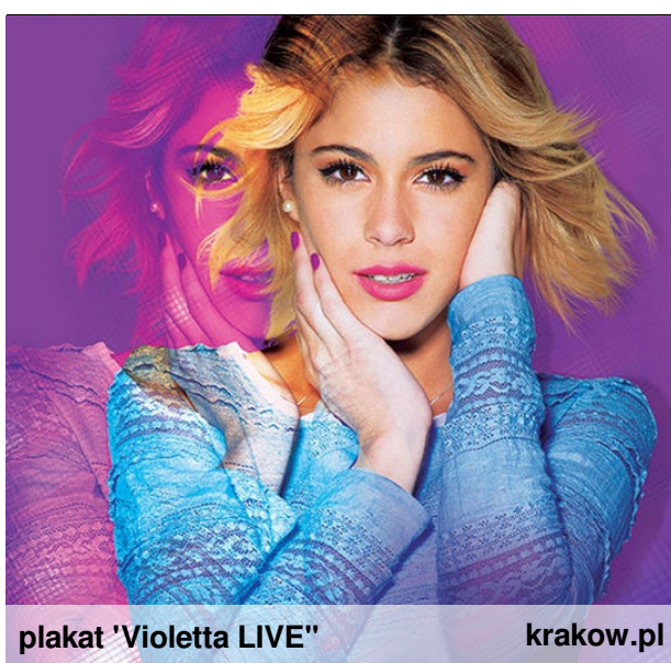
plakat 'Violetta LIVE'

Najtańsze dostępne bilety będą w cenie 129 zł. „Violetta” ma ponad 350 mln odsłon na portalu YouTube i tym przebija Justina Biebera. Najbliższy koncert odbędzie się w Warszawie i w Krakowie. Ewa Mularczyk