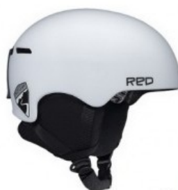
Kask, Red, 269 zł