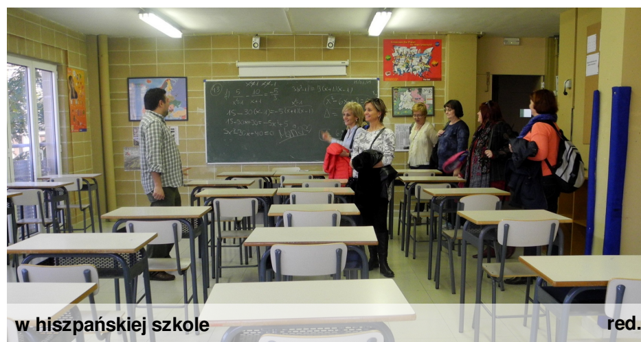
w hiszpańskiej szkole