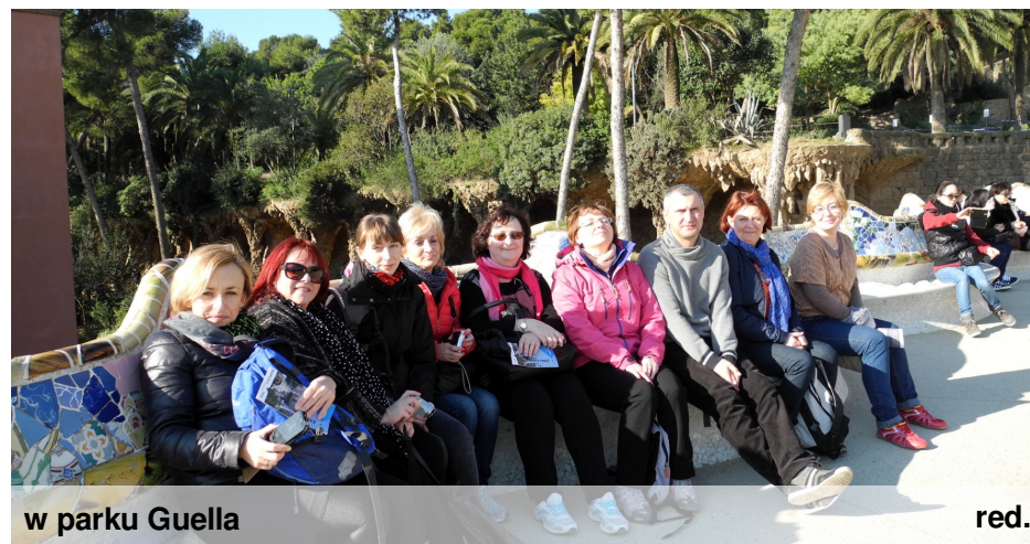
w parku Guella