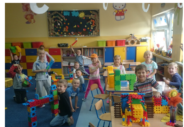
w swoim żywiole