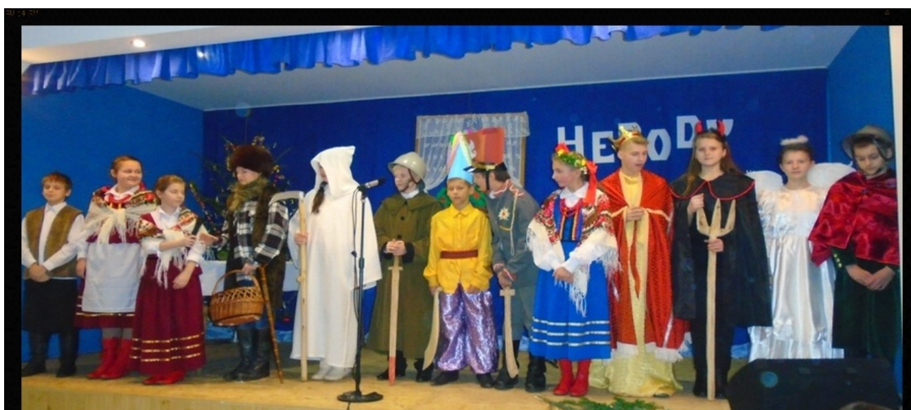
Kolędnicza grupa HERODÓW