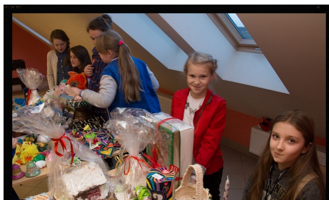
Oj, w CTL też się działo!