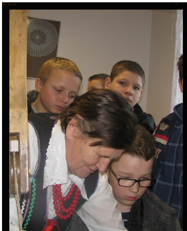
Przy tkackim warsztacie