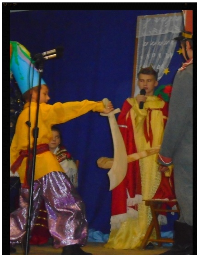
Walka Turka z Ułanem