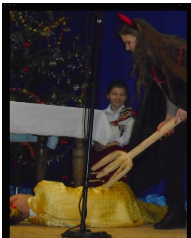
Masz za swoje Herodzie!