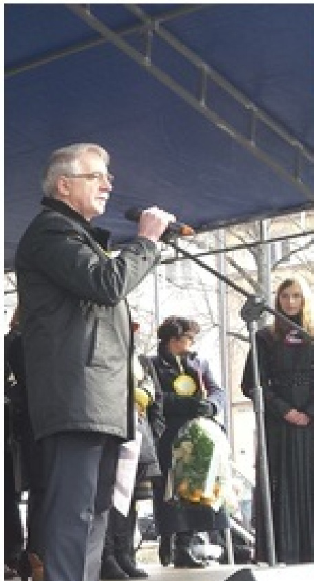
POLONEZ MATURZYSTÓW 2015