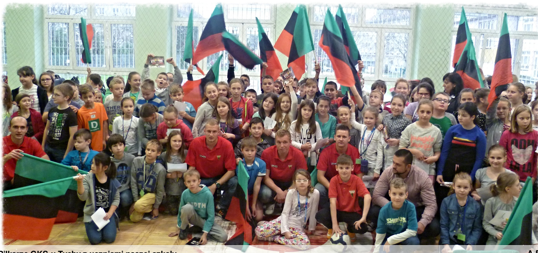
Piłkarze GKS-u Tychy z uczniami naszej szkoły