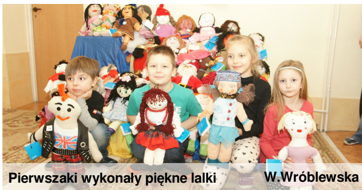
Pierwszaki wykonały piękne lalki W.Wróblewska