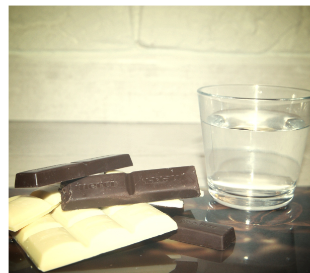
Czekolada-dobra na wszystko