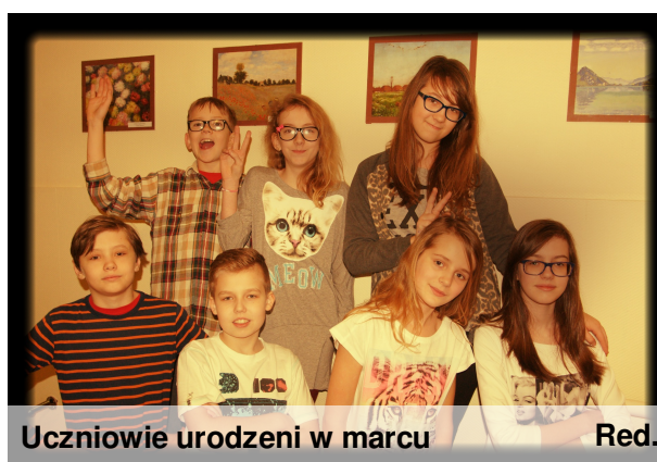
Uczniowie urodzeni w marcu

Większość dzieci organizuje urodziny dla kolegów z klasy. Młodszy zazwyczaj w Fikolandzie, a starsi, np. w kręgielni lub na świeżym powietrzu. Jest to ciekawy sposób na spędzenie czasu wraz z przyjaciółmi.