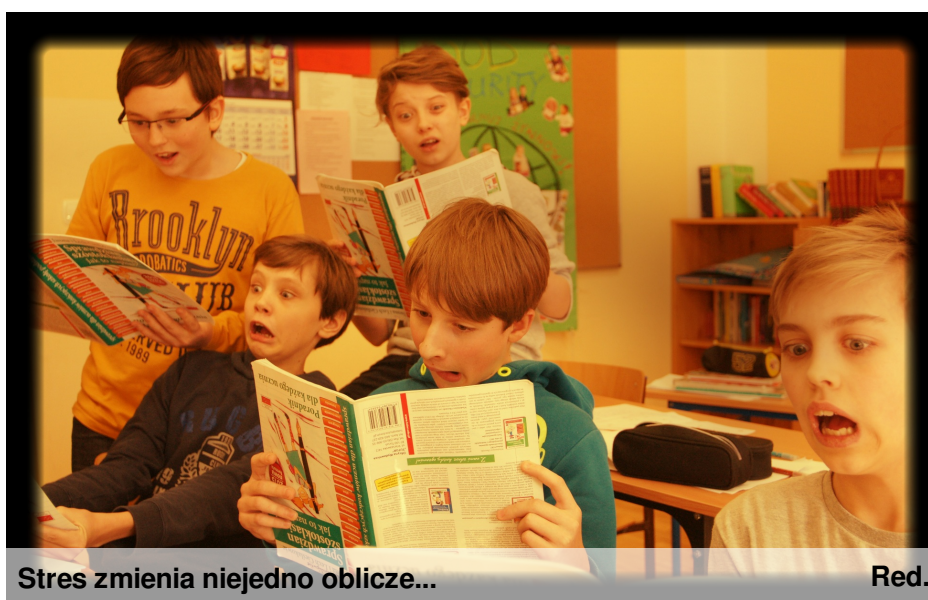
Stres zmienia niejedno oblicze...

Przed szóstkłasiastami ich pierwszy ważny egzamin- sprawdzian, który napiszą 1 kwietnia. Sama myśl o nim stresuje. Jak sobie poradzić ze stresem? Jak zminimalizować jego skutki i wyciszyć emocje?