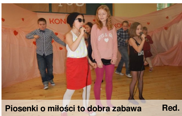
Piosenki o miłości to dobra zabawa