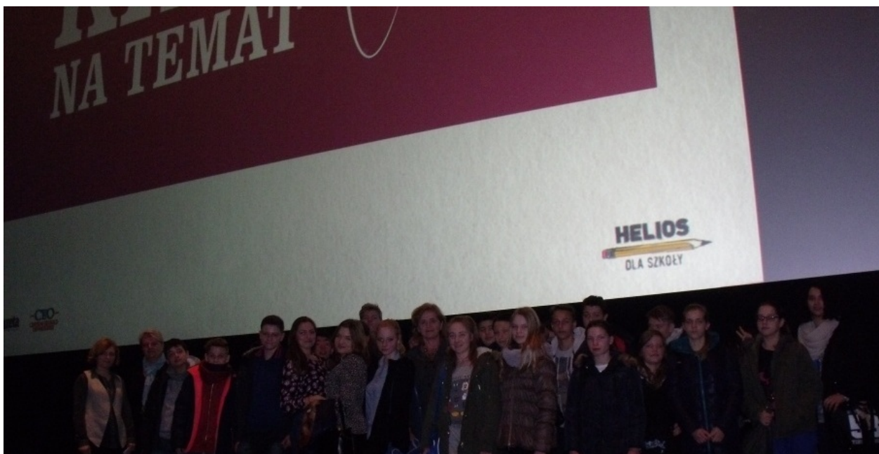
DKF w kinie Helios