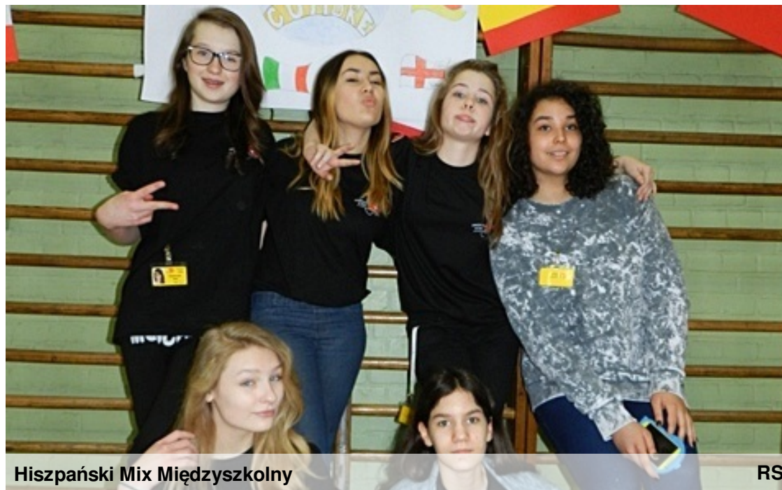
Hiszpański Mix Międzyszkolny

W programie podchody matematyczne, zabawy ze światłem, zagadki przyrodnicze, pomoc przedmedyczna oraz Familiada, czyli zmagania drużynowe! Przyjdź, zobacz, wystartuj! Zapraszamy!