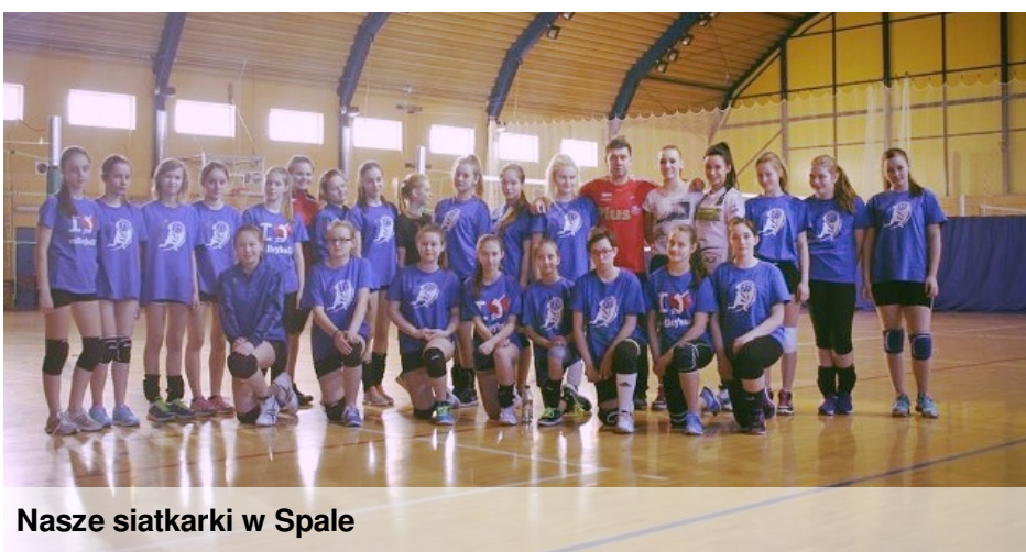
Nasze siatkarki w Spale