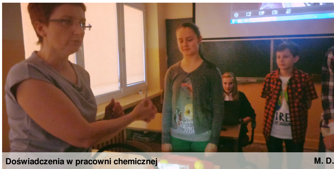
Doświadczenia w pracowni chemicznej