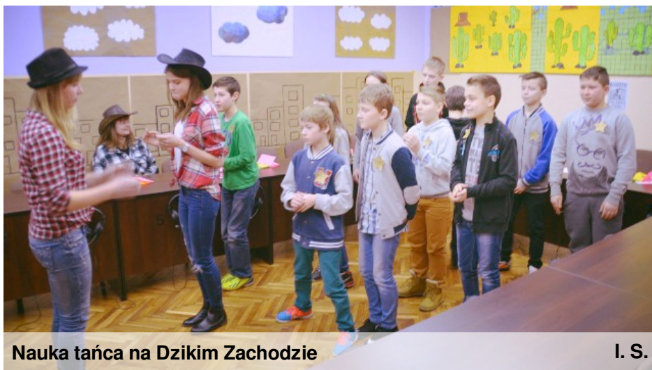
Nauka tańca na Dzikim Zachodzie