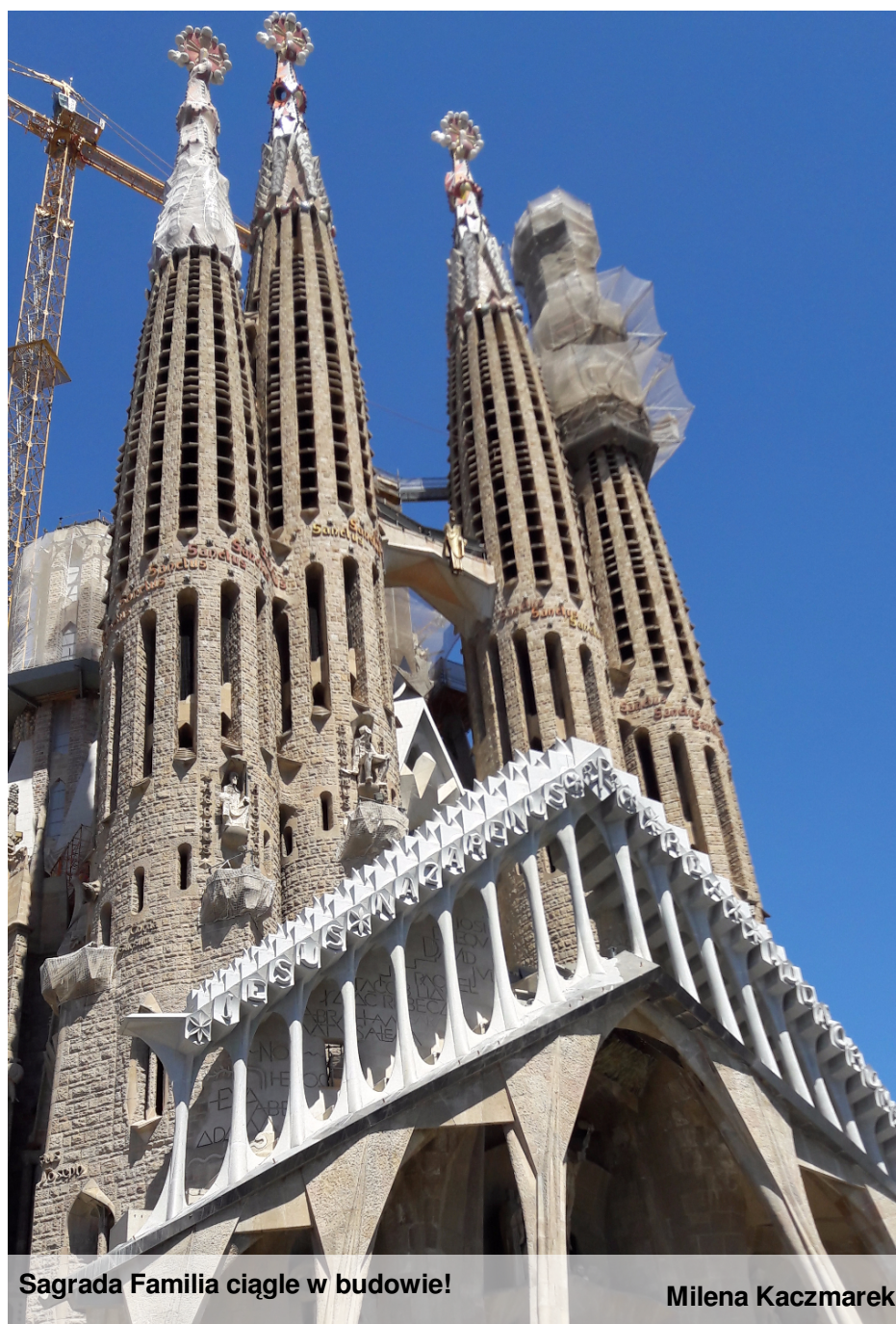
Sagrada Familia ciągle w budowie!