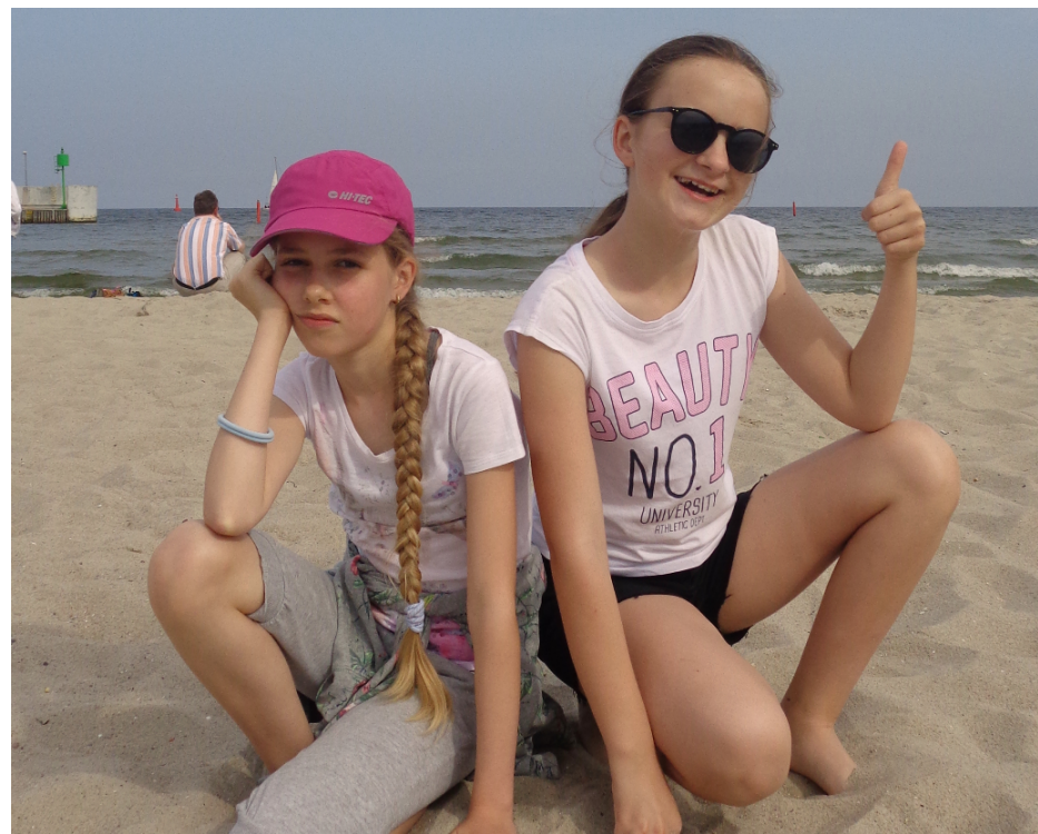
Uśmiechnij się, jesteś na plaży :)