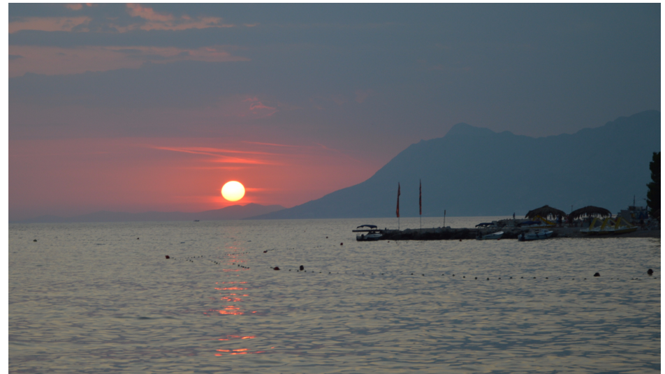
Zachód słońca nad Adriatykiem

23 czerwca – zakończenie roku dla klas 4-6 SSP i I-III SGJ (godz. 9.00, Centrum Kultury MUZA w Lubinie)