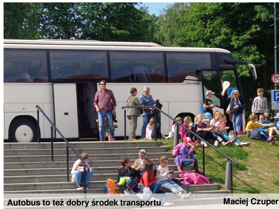
Autobus to też dobry środek transportu