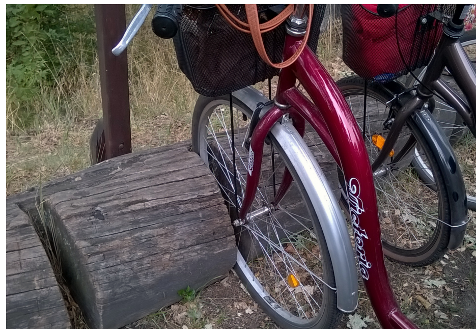
Oryginalne stojaki na rowery w Miliczu