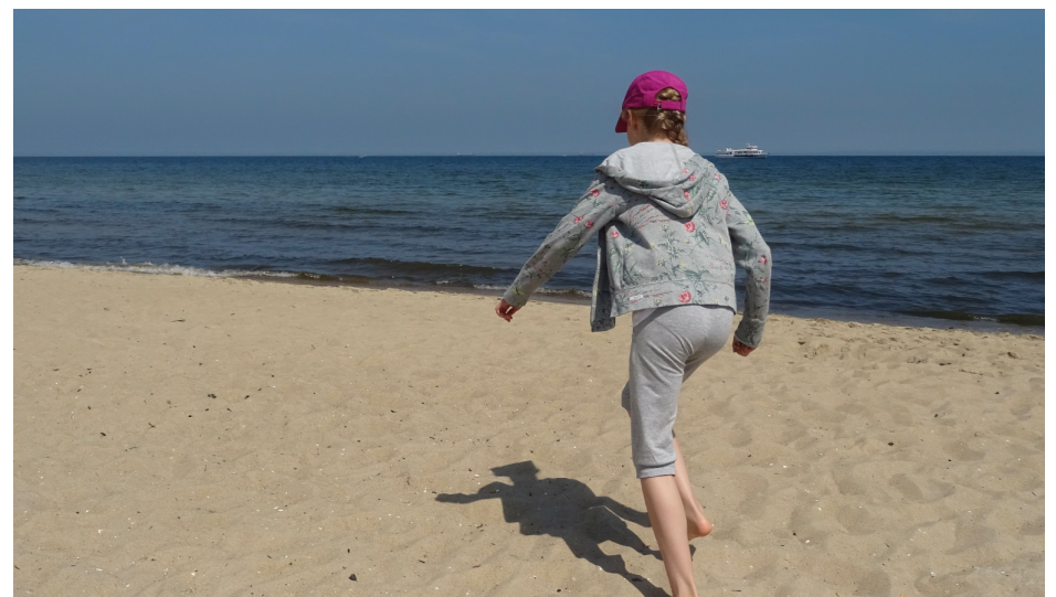
Można też pobiegać na plaży!