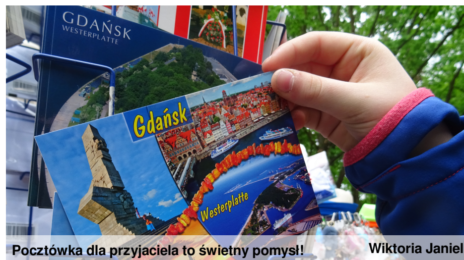
Pocztówka dla przyjaciela to świetny pomysł!