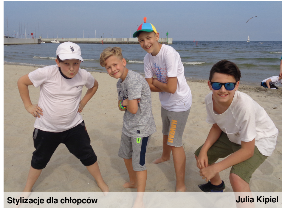
Stylizacje dla chłopaków