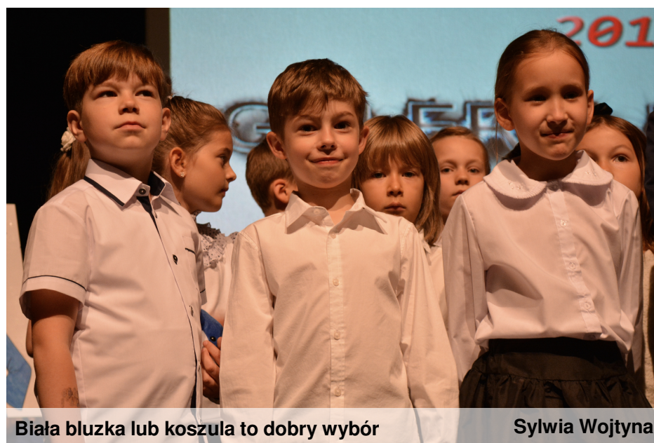
Biała bluzka lub koszula to dobry wybór