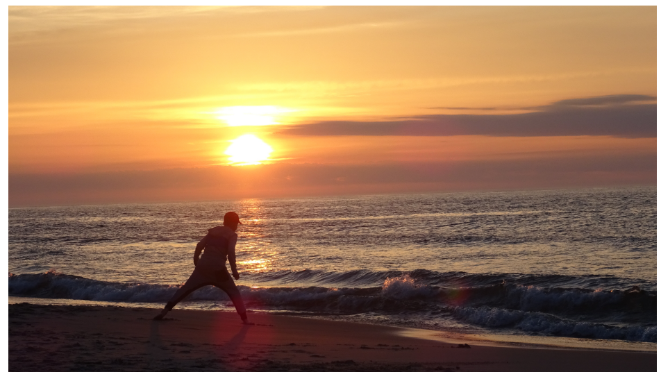
Zachód słońca nad Bałtykiem