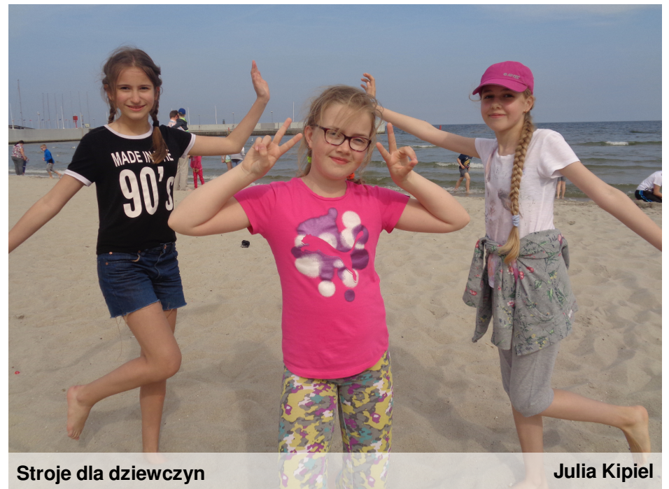
Stroje dla dziewczyn