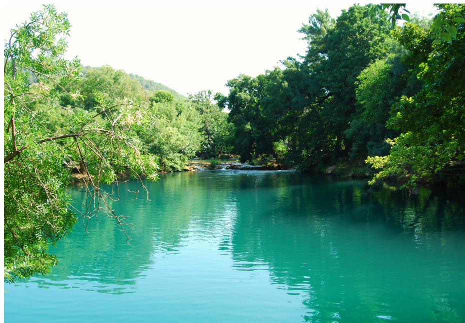
Jeziora Plitwickie w Chorwacji

Malta to piękny kraj osadzony na Morzu Śródziemnym. Panuje tam ciepły klimat i można tam spotkać różne zwierzęta takie jak jaszczurki, węże i przede wszystkim koty, od których się tam roi. Znajduje się tam piękny port rybacki Marsaxlokk, zachwycająca jest też stolica Valletta, w której wszędzie widać piękne balkoniki w charakterystycznych kolorach: zielonym, czerwonym i niebieskim, zapożyczone stylem z arabskich krajów. Z każdej strony Malta jest otoczona morzem, a widoki są po prostu przepiękne. Malta ma też piękną historię. 9 kwietnia 1942 roku, podczas popołudniowego nalotu Luftwaffe, 500 kg bomba przebiła kopułę kościoła o nazwie Rotunda w mieście Mosta i spadła między grupę wiernych. Bomba nie wybuchła. (cd. str. 4).