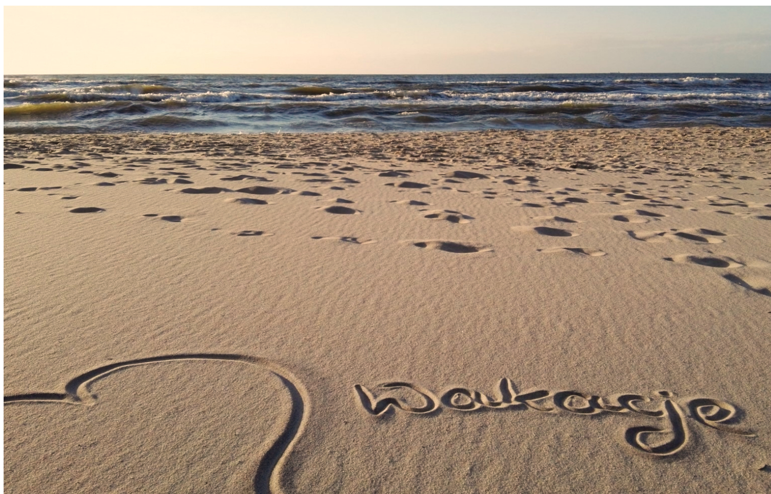
W oczekiwaniu na słońce i plażę