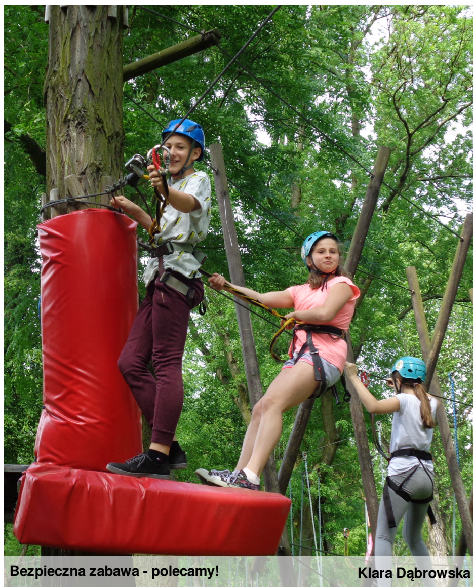
Bezpieczna zabawa - polecamy!