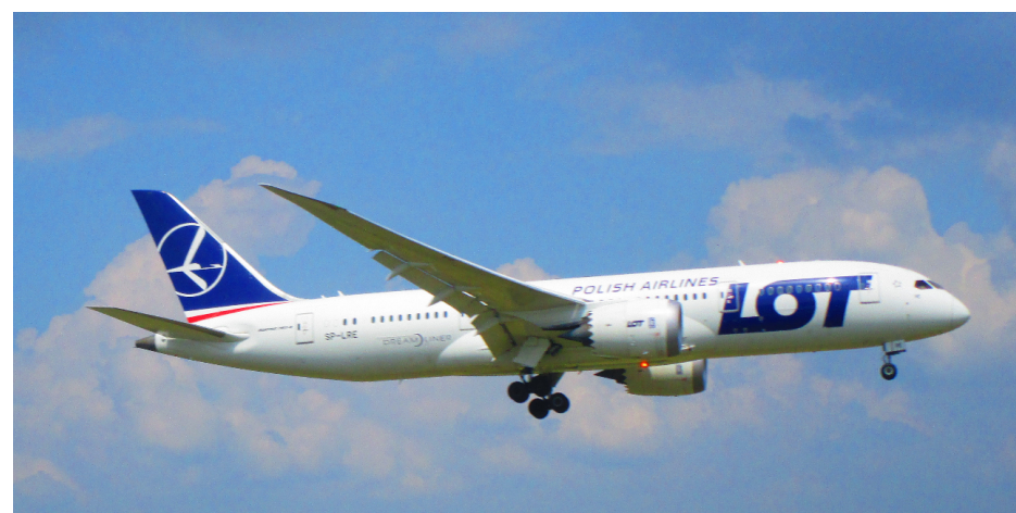
Nie bójmy się latać!