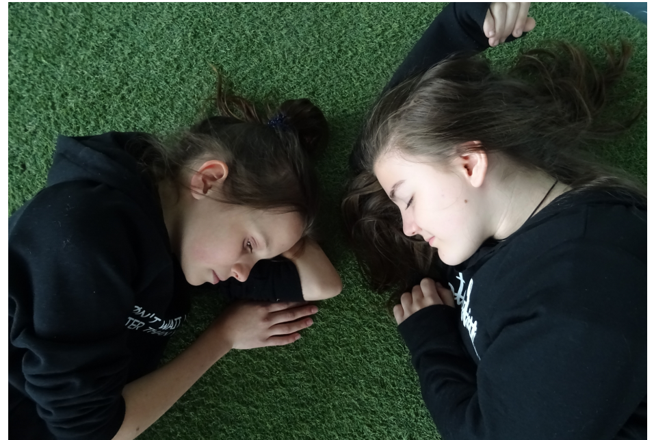
Latem można się nudzić...