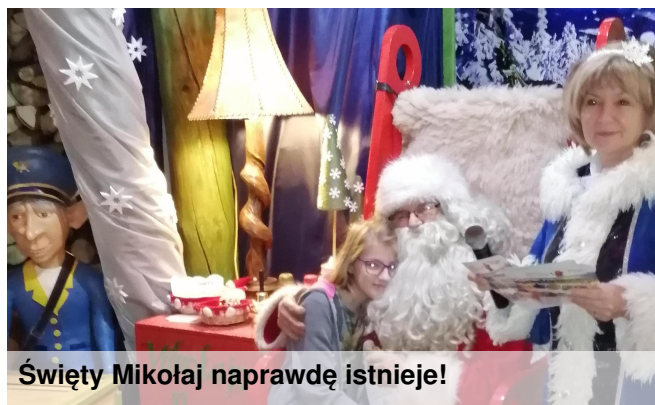
Święty Mikołaj naprawdę istnieje!