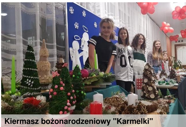
Kiermasz bożonarodzeniowy "Karmelki"