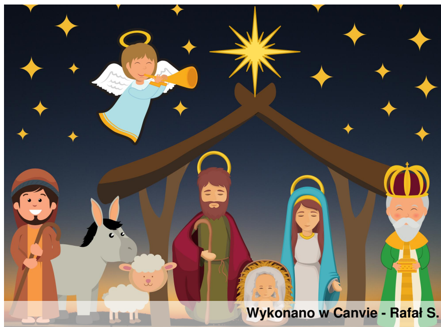
Wykonano w Canvie - Rafał S.