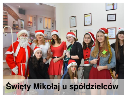
Święty Mikołaj u spółdzielców