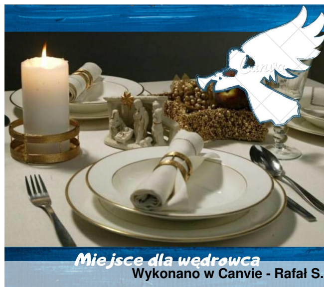
Miejsce dla wędrowca Wykonano w Canvie - Rafał S.