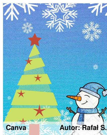
Canva Autor: Rafał S.