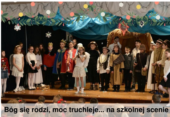
Bóg się rodzi, moc truchleje... na szkolnej scenie