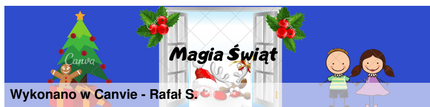
Wykonano w Canvie - Rafał S.